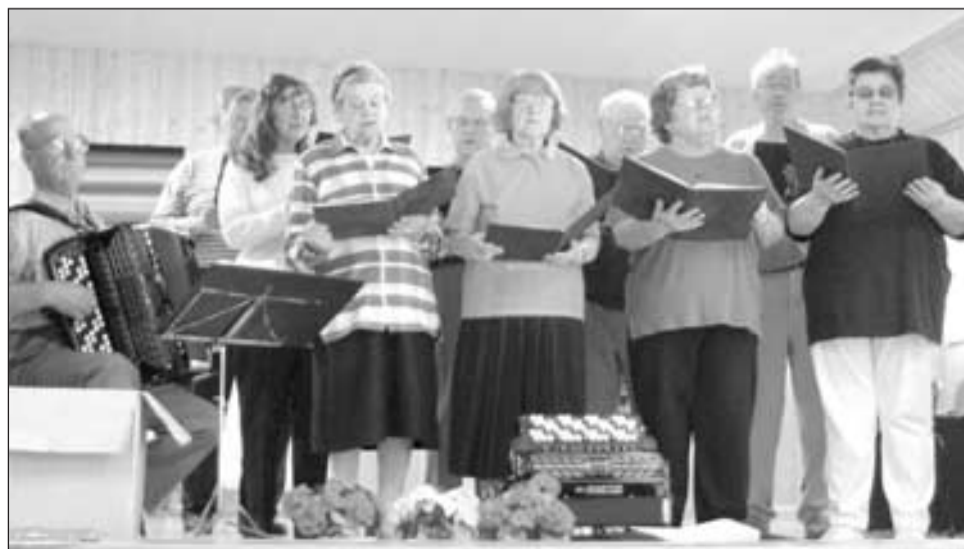
Yhdistyksessä ehditään myös harrastamaan ja viihtymään. Yhdistyksen kuoro esiintymässä kerhotapaamisessa.

Yhdistys julkisti kaupunkihankkeesta huhtikuussa kannanotton. Sen mukaan kuntamuotoa ja nimitystä tärkeämpää on, kuinka kunta todella toimii. Kaupunki-Eura voisi hyvinkin käyttää voimavaroja vain tyydyttämään talouselämän tarpeita ja unohtaa kuntalaisten sosiaalija terveyspalvelujen kehittämisen.