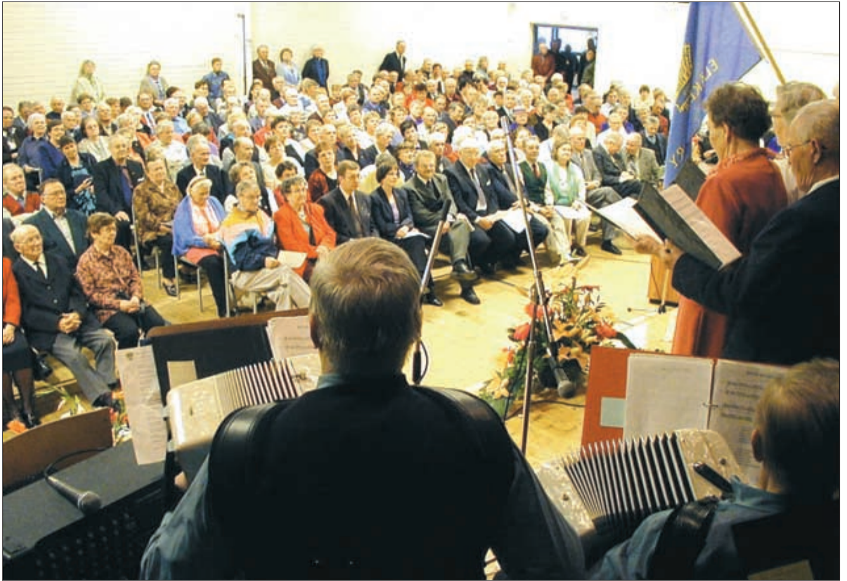
Kemijärven työväen viihdeorkesteri soitti, Sallan eläkeläiset lauloivat, yläasteen sali oli täynnä juhlaväkeä.